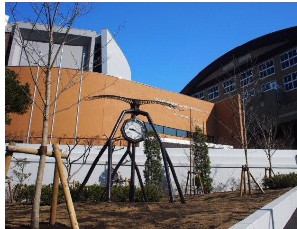
来校者を出迎える時計台 下 講堂ホール 520席