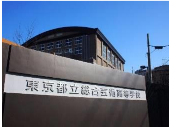
新宿御苑前駅寄りの正門(曙橋駅寄りの東門もあります)

◎芸術の専門教育を学ぶために建築された校舎では、現在約500人の生徒が学んでいます。施設の一部をご紹介します。