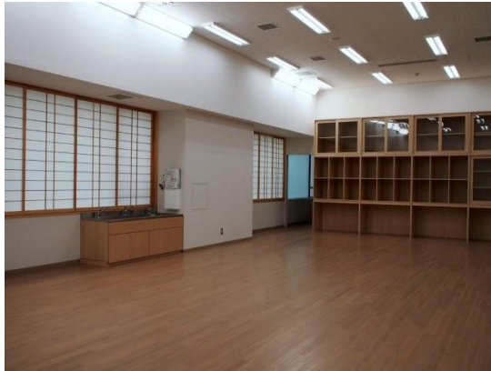
日本画や油彩画、デザイン等専用アトリエが12室 他にも映像スタジオ、陶芸室、版画室等があります 下 舞台演習室