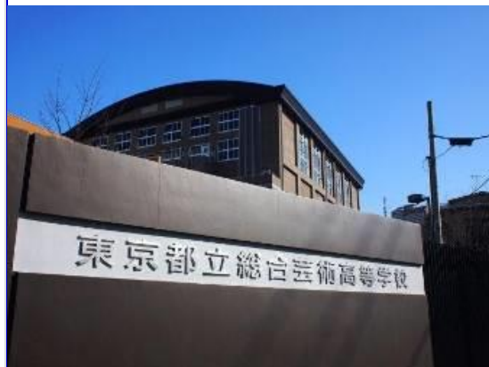
新宿御苑前駅寄りの正門(曙橋駅寄りの東門もあります)

◎芸術の専門教育を学ぶために建築された校舎では、現在約500人の生徒が学んでいます。施設の一部をご紹介します。