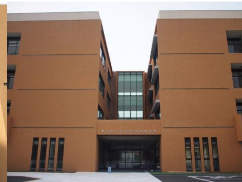
体育館棟 アリーナ