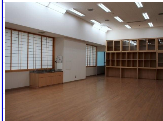
日本画や油彩画、デザイン等専用アトリエが12室 他にも映像スタジオ、陶芸室、版画室等があります 下 舞台演習室